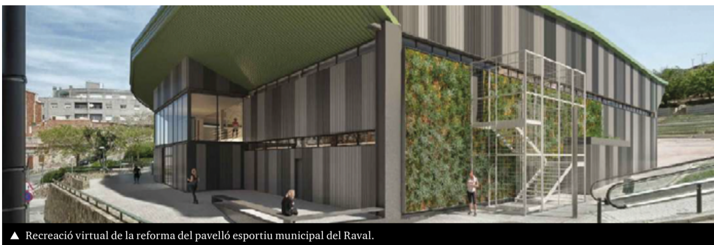
▲ Recreació virtual de la reforma del pavelló esportiu municipal del Raval.

La ciutat disposa ara de 22 equipaments municipals i 8 espais complementaris