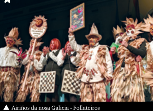
▲ Airiños da nosa Galicia - Follateiros