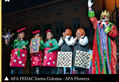
▲ AFA FEDAC Santa Coloma - AFA Flowers