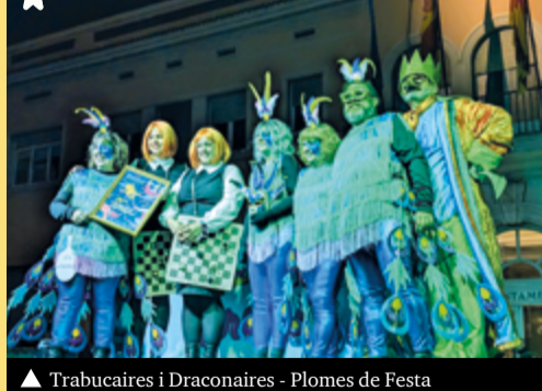
▲ Trabucaires i Draconaires - Plomes de Festa