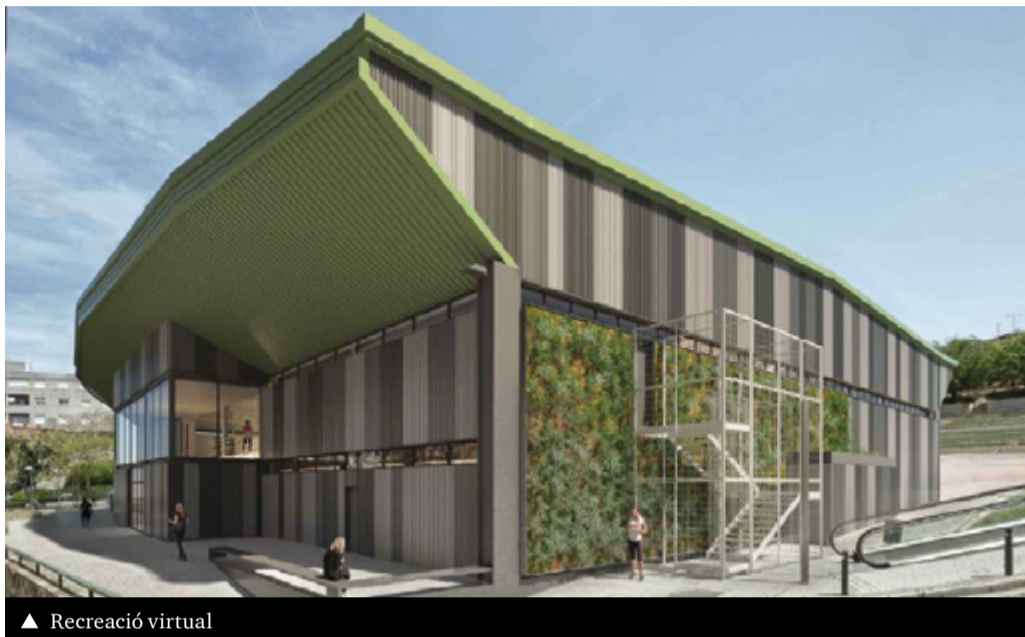
▲ Recreació virtual

La intervenció permetrà que l'edifici sigui autosuficient energèticament, o de consum gairebé nul, amb la producció d'energia solar fotovoltaica que cobrirà la totalitat de la demanda energètica (aigua calenta sanitària, electricitat, enllumenat, ventilació i calefacció). També es millorarà la integració de l'equipament a l'entorn amb estratègies de naturalització que incrementin el verd urbà i la biodiversitat.